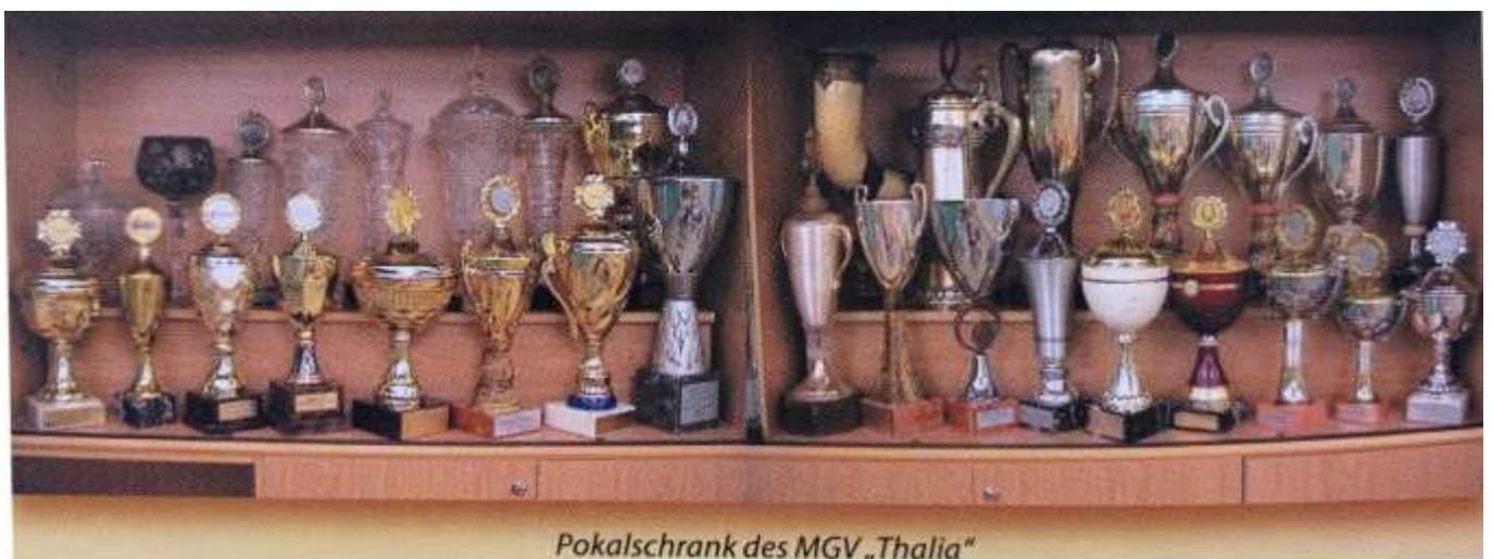
Pokalschrank des MGV „Thalia“

Der Männerchor konnte auf vielen Wettstreiten sein Können unter Beweis stellen.