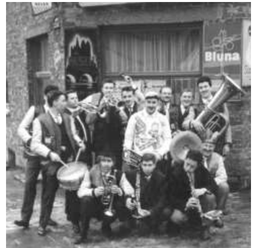
Kapelle Mattes 1960 vor der Bürgerstube