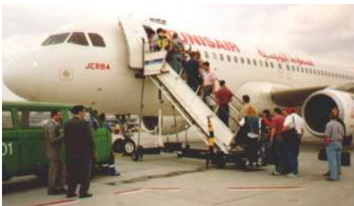
Abflug nach Tunesien El Jem 1992

Bei der Zweiten Reise nach Tunesien wurden Kontakte zur Keramikindustrie geknüpft.