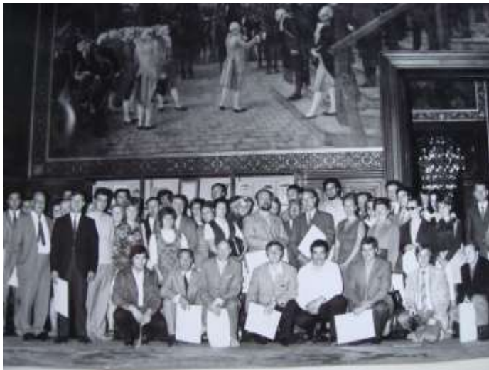
Rathaus Paris, 1971 Empfang Musikverein-Ebernahn