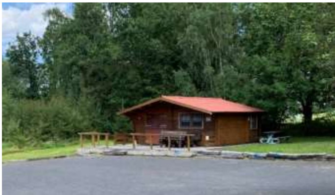
fehlt Bild HundeSV

Boule Club mit seinen silbernen Kugeln ist wie der Hunde Sportverein in den letzten Jahren mit eigenen Vereinshäuser dazu gekommen. (Bilder falls Platz)