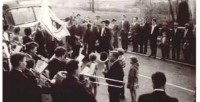
Musikverein holt MGV nach Wettstreitsieg Rh.Pf. an der Holl ab

Beim 110jährigen Bestehen 1990 kamen 51 befreundete Chöre mit 2.176 Sänger plus die Zuhörer nach Ebernhahn zum Chorwettbewerb. 7 Klassen haben in der Rosenheckhalle und 6 Klassen in der Halle der Fa. Griesar gesungen. Das ganze Dorf war auf den Beinen um die Gäste zu verköstigen.