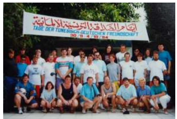
Empfang in Tunis 1994