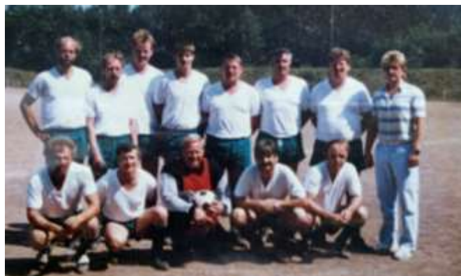
Alte Herren Dorfmeister 1986