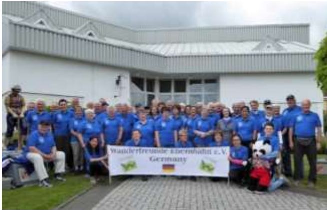
Wanderverein Ebernhahn 2017

Boule Club mit seinen silbernen Kugeln ist wie der Hunde Sportverein in den letzten Jahren mit eigenen Vereinshäuser dazu gekommen. (Bilder falls Platz)