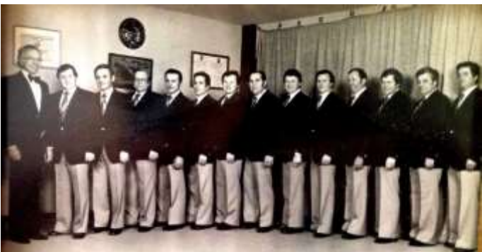
1965 Thalianer Chor

1965 wurde der Thalianer Chor, der für viele Jahre als herausragende Veranstaltungen wie Musicals engagiert wurde, gegründet. Der Chor aus Ebernhahn, weit über die Grenzen auch im In- und Ausland, bekannt, gab viele Konzerte und Gegenbesuche kamen zustande und auf Wettstreiten glänzte der Verein. Der Männerchor konnte auf vielen Wettstreiten sein Können unter Beweis stellen.