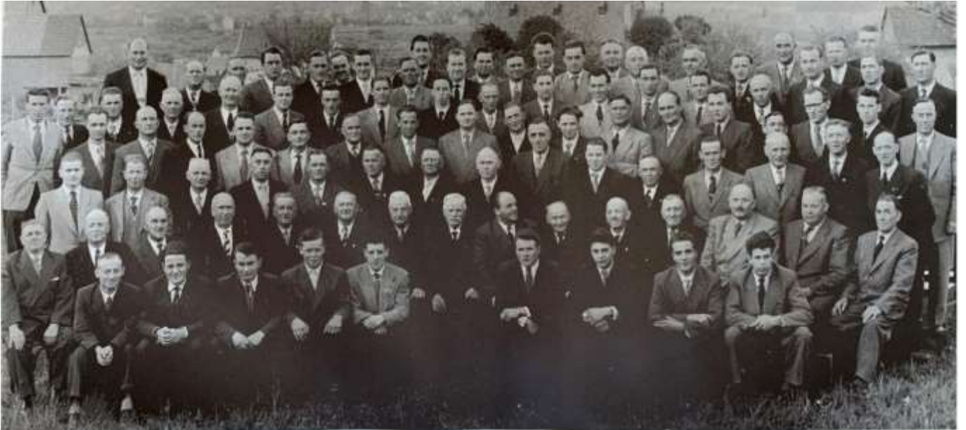
Männergesangverein Ebernhahn 1955 zum 75. igsten Jubiläum

1965 wurde der Thalianer Chor, der für viele Jahre als herausragende Veranstaltungen wie Musicals engagiert wurde, gegründet. Der Chor aus Ebernhahn, weit über die Grenzen auch im In- und Ausland, bekannt, gab viele Konzerte und Gegenbesuche kamen zustande und auf Wettstreiten glänzte der Verein. Der Männerchor konnte auf vielen Wettstreiten sein Können unter Beweis stellen.