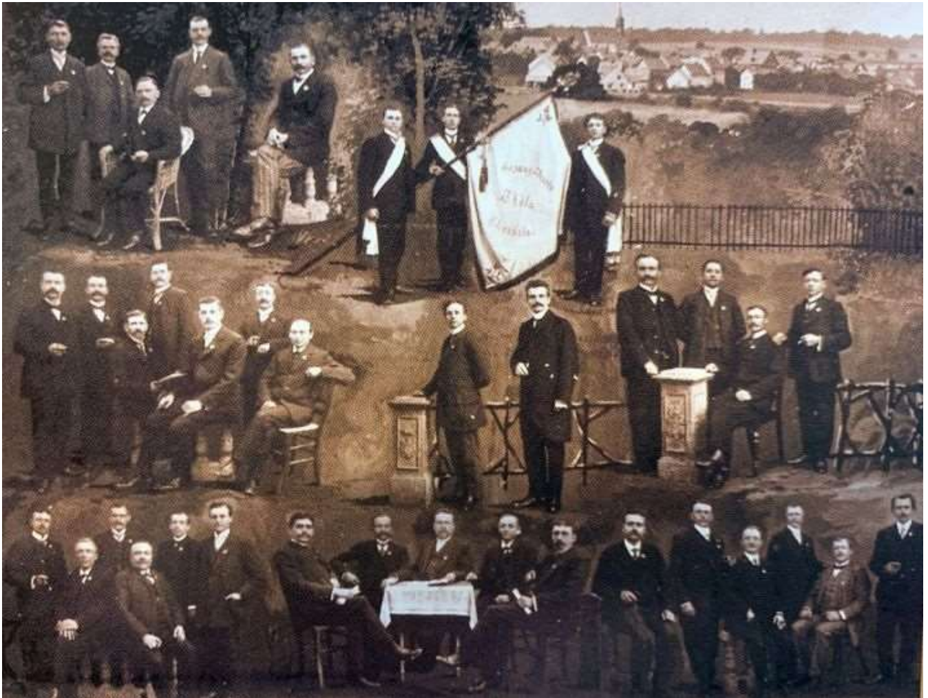
MGV1913 im Gründungsjahr des Musikvereins

1880 wurde der Männergesangsverein Thalia Ebernhahn gegründet. Bis 1990 immer mit 66 bis 90 Sänger. Heute als Gemischter Chor "Thalia Ebernhahn" weit über die Grenzen von Ebernhahn beliebt und bekannt.