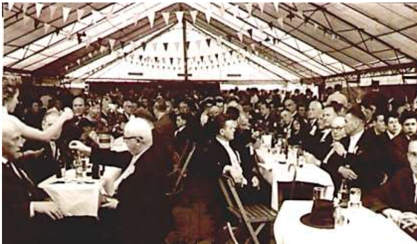
1963 Musikfest 50 Jahre MV 1913 e.V.

Der Musikverein 1913 nach 1949 musizierte man mit den ehemaligen Musikern im kleinen Kreise. Die verbliebenen wenigen Musiker spielten lediglich noch die Fronleichnamsprozession im Dorf, die aber nur durch die Mithilfe auswärtiger Musiker zu bewältigen war. Kirche und Gemeinde erkannten die Notwendigkeit und Bedeutung eines Blasorchester im religiösen und kulturellen Leben eines Dorfes. Ein Aufruf des damaligen Pfarrers Hein und die Zusage einer finanziellen Unterstützung durch die Zivilgemeinde gaben den Anstoß zur Wiederbelebung des Musikvereins. In der Woche nach dem Fronleichnamfest 1958 fand im Bürgermeisteramt eine Versammlung statt, deren einziges Ziel es war, junge Leute zu finden, die bereit waren, ein Musikinstrument zu erlernen und in den Musikverein einzutreten. Hierzu hatte Bürgermeister Schneider die „alten Musiker“ zu einer Beratung eingeladen. Zusätzlich wurde 1960 durch Lehrer Braun 14 Schüler geworben die ein Instrument lernten und Eltern über Raten abbezahlen.