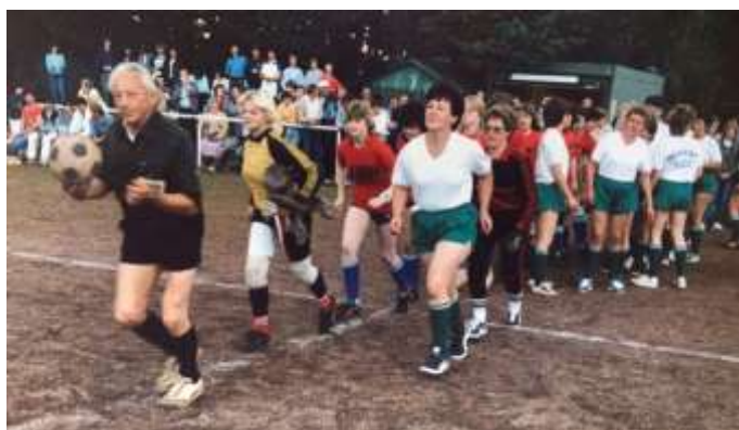
Die Frauen der Fussballer spielen gegen Ihre Männer